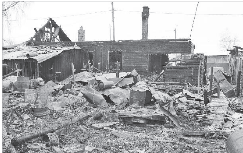
Последствия пожара 7 февраля в с. Первомайском.