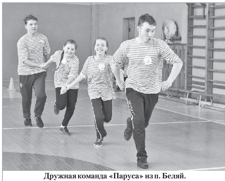
Дружная команда «Паруса» из п. Беляй.

Спортивный фестиваль семейных команд, участниками которого стали замещающие семьи из Первомайского и Асиновского районов, прошёл в феврале в ДЮСШ. Дружные, весёлые дети и взрослые не просто соревновались, а получали настоящее удовольствие от выполнения конкурсных заданий.