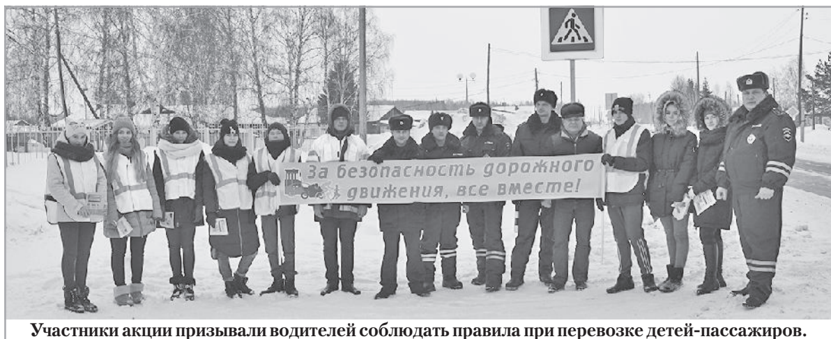
Участники акции призывали водителей соблюдать правила при перевозке детей-пассажиров.

Эту информацию и пытались донести до водителей участники акции «Молодёжь за безопасность дорожного движения!» Местом её проведения выбрали территорию возле детского сада «Сказка». Ребята отправились туда, взяв с собой плакаты с призывами и листовки-памятки.