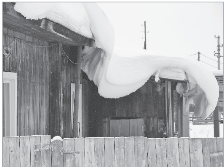
Фотоэтиюд Т. Неберо, с. Первомайское.