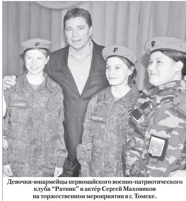
Девочки-юнармейцы первомайского военно-патриотического клуба «Ратник» и актер Сергей Маховиков на торжественном мероприятии в г. Томске.

Нужно отметить, что стать юнармейцем может любой школьник, военно-патриотическая организация, клуб или поис-