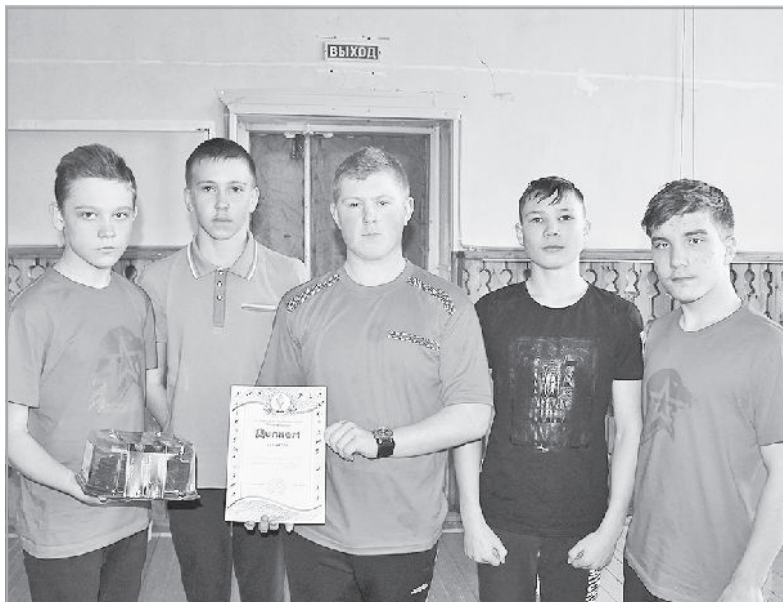
Объединённая команда поискового отряда «Земляки» и военно-патриотического клуба «Ратник» стала победителем конкурса «Русский парень».

«Русский парень» – мужской турнир, который традиционно посвящается Дню защитника Отечества.