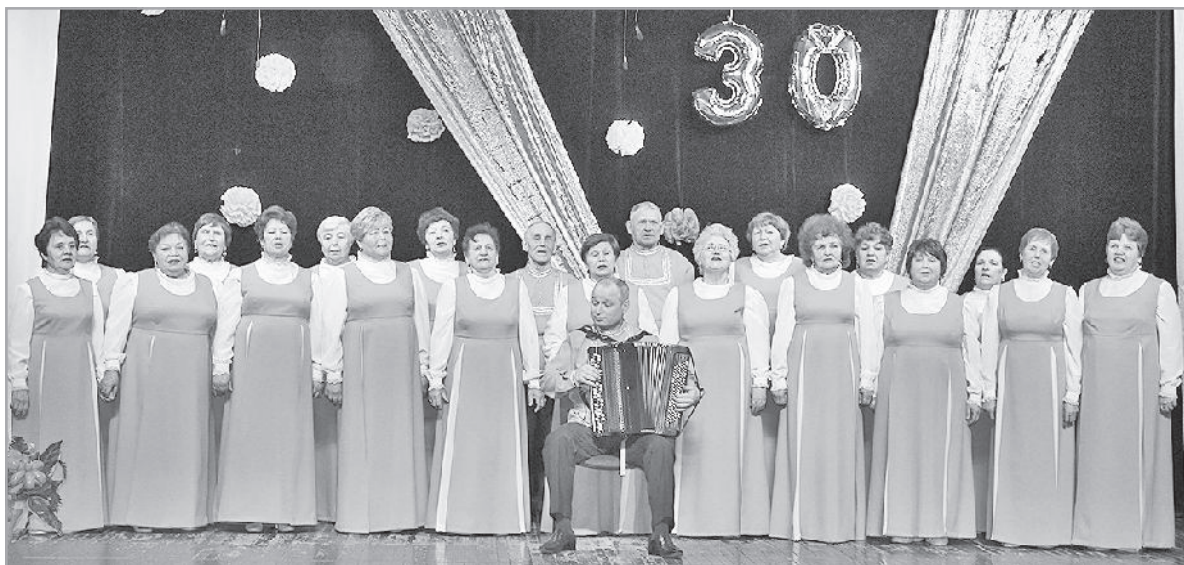
В день юбилея артисты хора «Рябинушка» порадовали зрителей новыми песнями и новыми костюмами.

Первомайский хор ветеранов «Рябинушка» в этом году отмечает 30-летие. Праздничный концерт по этому поводу прошёл на днях в КЦ «Чулым».