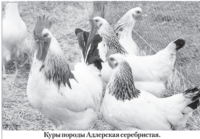
Куры породы Адлерская серебристая.