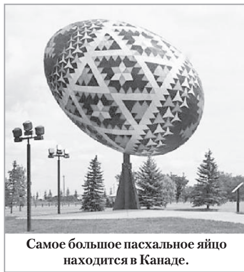
Самое большое пасхальное яйцо находится в Канаде.

✓ Традиция ставить у алтаря во время ночной пасхальной службы большую свечу существует во всех христианских странах. От этой свечи потом зажигают все остальные светильники в церкви. Ритуал зародился в 4 веке нашей эры, причем главная свеча является символом Иисуса Христа, а её священный пламя – символом Воскресения.