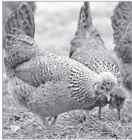
Особенность кур породы Легбар – голубые и зелёные яйца.