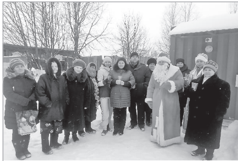
В Куянове в числе первых чистую водицу отведал Дед Мороз.

К сожалению, не всё было так радужно. В Первомайском в первые же дни работы станции кто-то повредил кнопку подачи воды. Поломка была оператив-